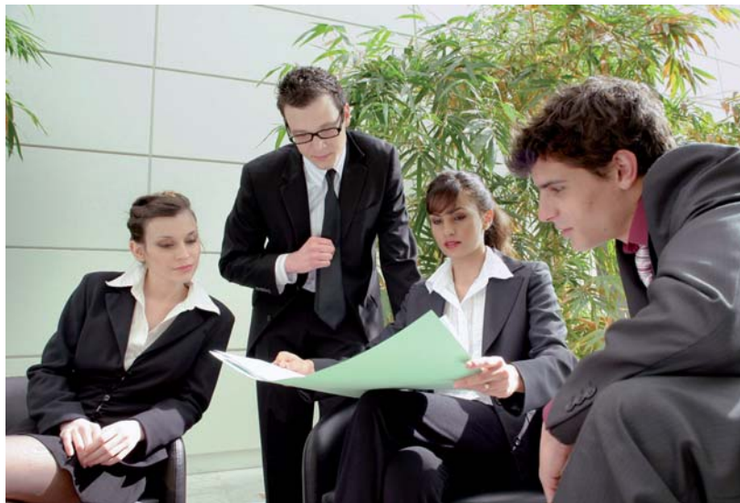
Pese a la crisis, la actividad emprendedora ha aumentado un 120% en España.