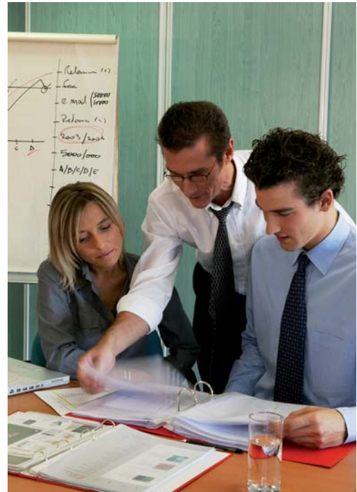
Las empresas han de implantar medidas en sus organizaciones para mantenerse en el mercado.

A su vez, y en el capítulo de inversiones, las previsiones españolas están muy limitadas por las condiciones económicas, lo que lleva a que las empresas de todas las regio-