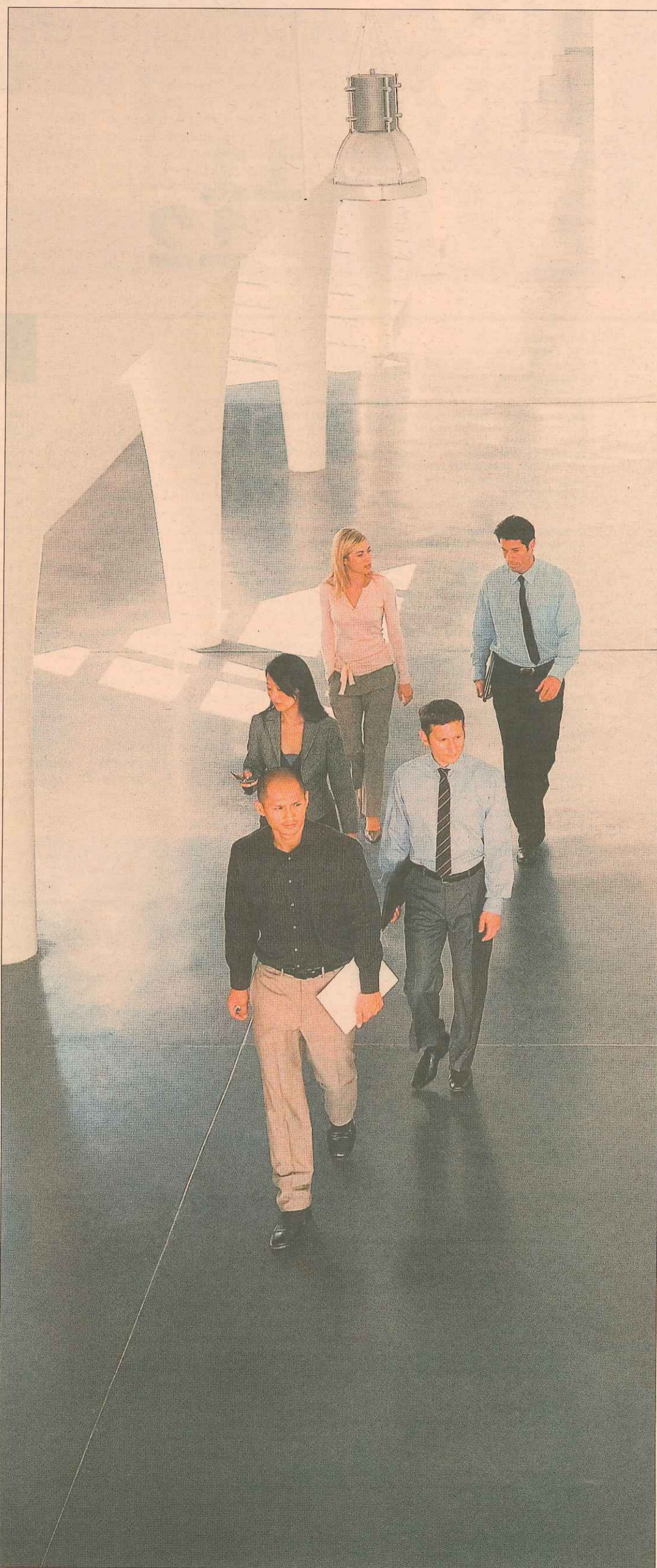
El 20% del alumnado de las escuelas de negocios españolas es internacional.

Algunos centros han optado por la especialización. "Como en todo, o buscas volumen o buscas especialización y te centras en lo que conoces", expone Ramón Aragón, director de Relaciones Externas de ESCP Europe, que se distingue por su "dimensión internacional": una estructura mul-